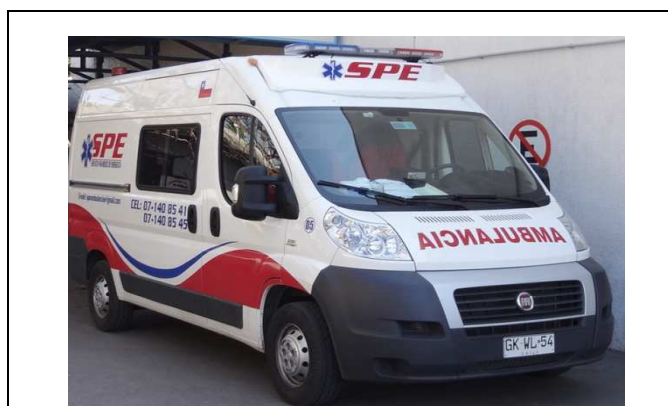
IMG. N°00 1: EP Santiago 1

Comentario: Ambulancia del Servicio de Salud