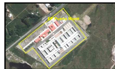
Emplazamientos Establecimientos Penitenciarios Grupo 3